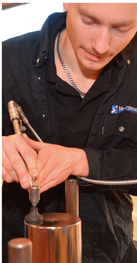
L-tech och Verktygsservice bistår med helheten. Ett moment av alla är högljanspolering och putsning.