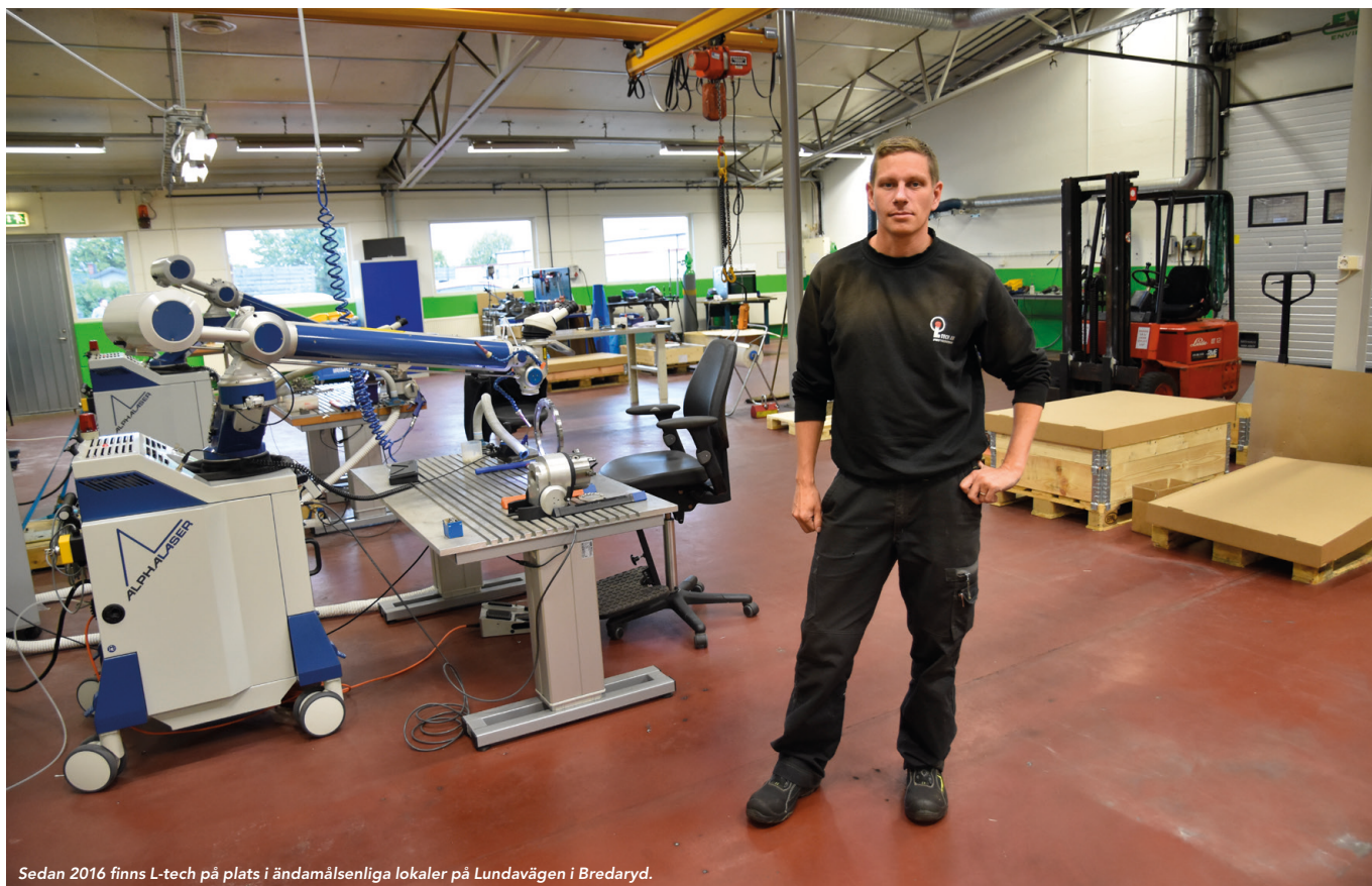
Sedan 2016 finns L-tech på plats i ändamålsenliga lokaler på Lundavägen i Bredaryd.